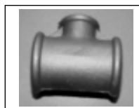
Trišakis redukuotas 130R