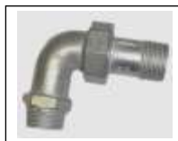
Alkune iš./iš.sr. išardoma 95 (juoda)