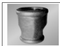
Mova redukuota 240