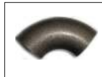
Alkune plienine virinama 92003