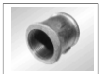
Mova v./v. sr. 270