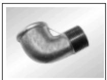
Alkune v./iš. sr. 92