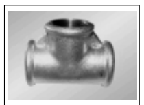
Trišakis v./v. sr. 130