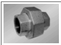
Jungtis išardoma v./v. sr. 330 (juoda)