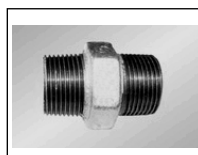
Nipelis iš./iš. sr. 280