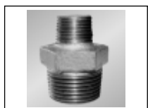
Nipelis redukuotas iš./iš.sr. 245