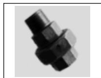
Jungtis išard. v./iš. sr. 331