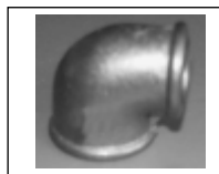
Alkune redukuota 90R (juoda)