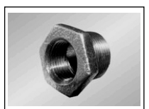
Perejimas iš./vid. sr. 241