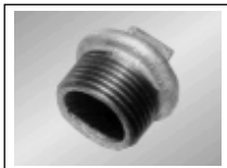
Akle iš.sr. 290